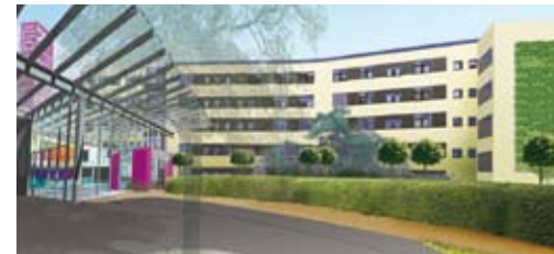
Allgemeine Klinik, Krankenhausstraße 2, Bad Segeberg

Nachdem am Standort Bad Segeberg in den SEGEBERGER KLINIKEN bereits eine Vielzahl von Fachrichtungen vertreten sind, ist seit dem 1. Januar 2006 eine akut-neurologische Abteilung zu dem bereits bestehenden Neurologischen Rehabilitationszentrum hinzugekommen. Die akut-neurologische Abteilung wurde am Allgemeinen Krankenhaus (Krankenhausstraße 2, Bad Segeberg) eingerichtet.